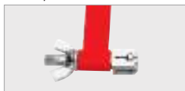
Четырёхгранный зажим с поперечными пазами